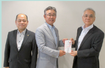
▲ライオンズクラブ国際協会