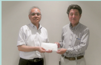
▲NKハウジング株式会社「建正会」