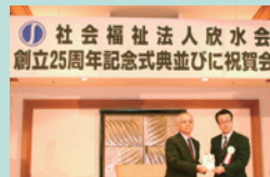
▲社会福祉法人 欣水会