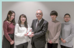
▲つくば国際大学看護サークル