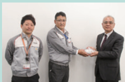
▲日立建機株式会社