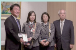
▲古河ヤクルト販売株式会社