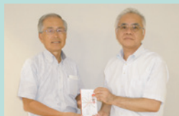
▲茨城YMCAチャリティゴルフ大会実行委員会