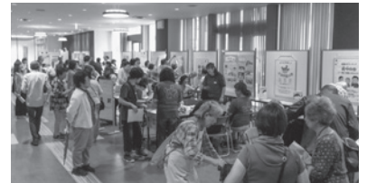
ボランティアまつりの様子