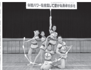
土浦第四中学校 新体操部