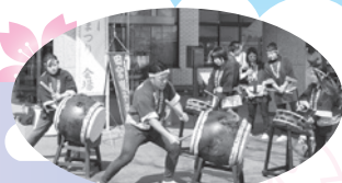
昨年の開会セレモニー 田宮囃子