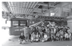
土浦消防本部消防庁舎見学