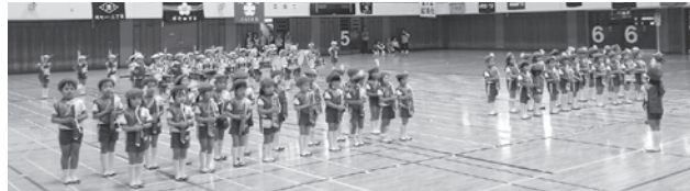
中央幼稚園 鼓笛隊