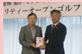
▲水戸信用金庫第5・第7ブロック