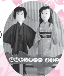
センタクんとフクちゃん