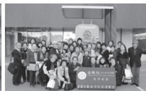
造幣局さいたま支局見学