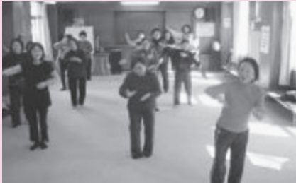
ふれあい・いきいきサロン

今回、掲載しました写真は、荒川沖東三丁目で活動している「いきいきサロンひまわり」と三中地区チャレンジクラブで行った福祉体験講座の様子です。