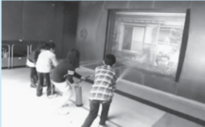
プロジェクトゼクス (防災館見学)

南部支部では、市民委員会と共催で、子ども達がボランティアに興味を持つきっかけ作りを目的に、児童ボランティア学習企画「プロジェクト・ゼクス」を実施しています。また、地域のひとり暮らし高齢者交流会も大変盛況で、多くの方に楽しんでいただいています。