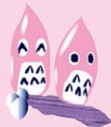
上大津公民館 イメージキャラクター 「カーミーとオーツ」