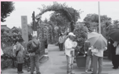
交流会 (つくばローズガーデン)

70歳以上のひとり暮らしの高齢者を対象に、年2回福祉バスを利用して市外へ外出する交流会を実施しています。毎回多くの方に参加していただき、仲間づくりや、地域の方と交流を深めながら、楽しく出かけています。