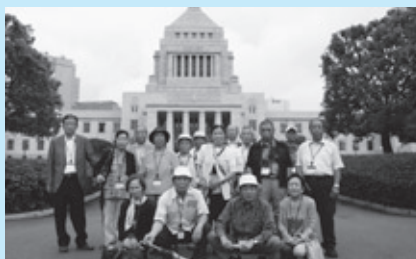
交流会 (国会議事堂)