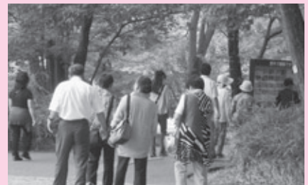
交流会（茨城県自然博物館）