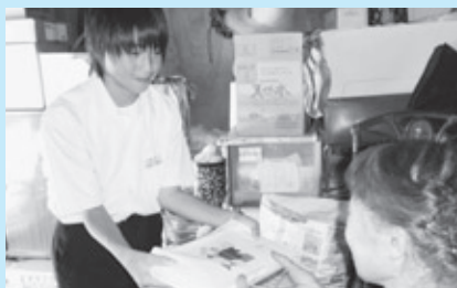
宅配（中学生の配達）