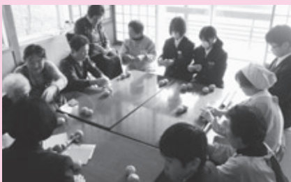
地域会食(第五中学校生徒との交流)

上大津支部では、70歳以上のひとり暮らしの方を対象とした会食会を、湖畔荘で開催しています。ボランティアグループかすみ会お手製のお弁当を食べた後、第五中学校生徒と唄や昔あそび等をして楽しいひと時を過ごしています。