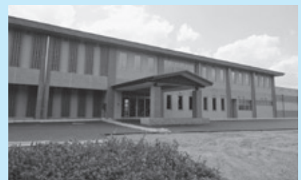
完成間近!!新治地区公民館!