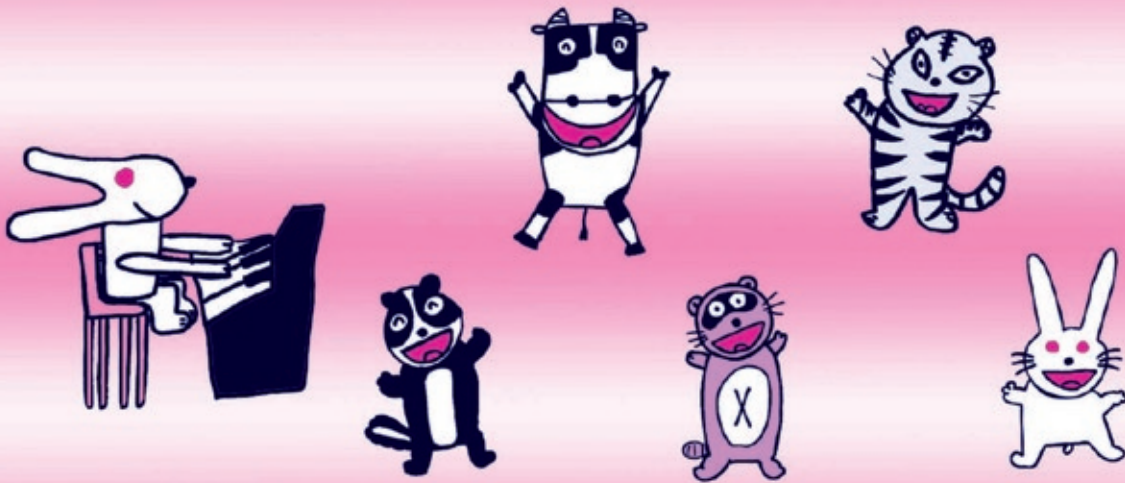
絵画協力：太田頼孝さん