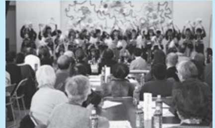
地域会食 (幼稚園児とのふれあい)