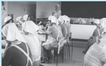
ボランティア研修(さくら会)