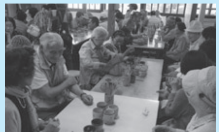
交流会（益子焼体験）