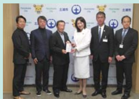
▲茨城県トラック協会土浦支部 様