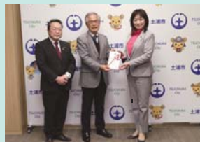
▲筑波銀行扇の会 様