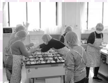
▲たまき会活動風景