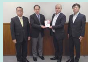
▲土浦地域労働者福祉協議会 様