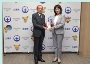
▲土浦市防火・危険物安全協会 様