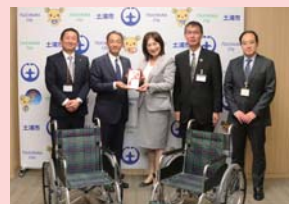
▲みとしん経営研究会 みとしん青年重役会 みとしん資産活用研究会 合同チャリティー オープンゴルフコンペ 様