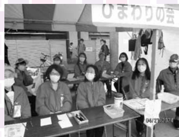
▲ひまわりの会活動風景