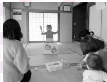
▲土浦市更生保護女性会活動風景